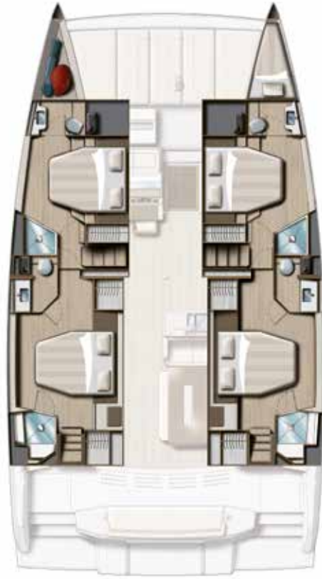
4 CABIN VERSION / 4 BATHS Version 4 cabines DOUBLES / 4 sdb