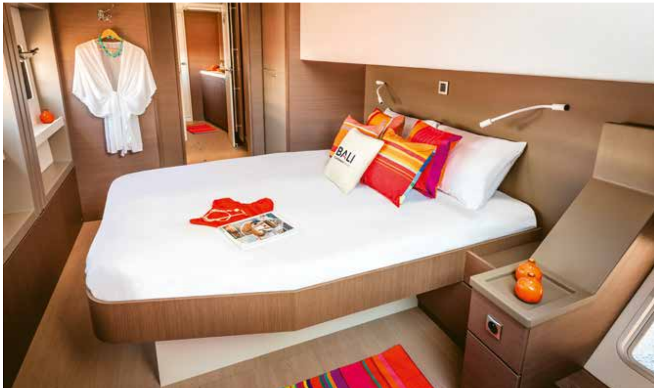
BALI CATAMARANS - BALI 4.8

Les cabines, où la modernité et le raffinement vont de pair, sont pensées pour le plus grand confort. Chaque cabine dispose d'une belle salle d'eau avec toilettes et douche. Les cabines arrières possèdent un accès indépendant via le cockpit. Le BALI 4.8 est le seul catamaran de sa catégorie à proposer une version avec 6 cabines et 6 salles d'eau.