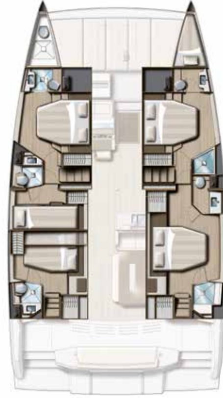
5 CABIN VERSION (4 DOUBLE + 1 TWIN) / 5 BATHS Cockpit & Salon Version 5 cabines (4 DOUBLES + 1 TWIN) / 5 sdb