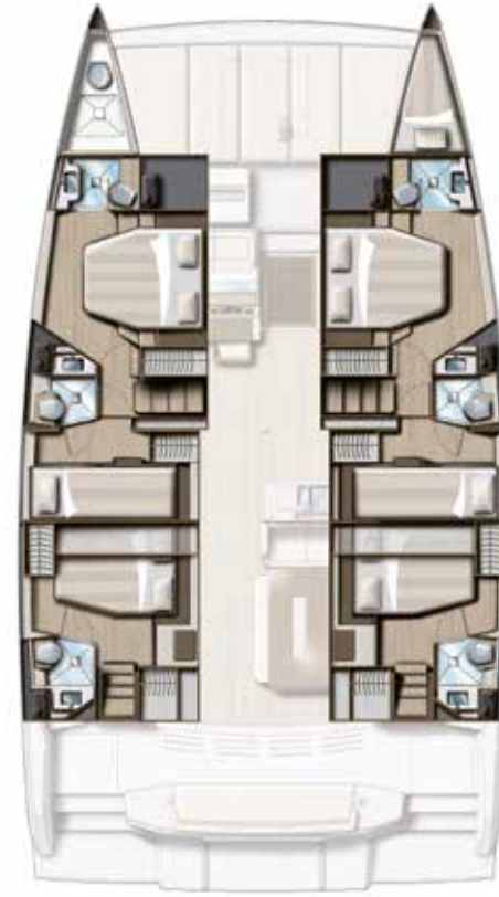
6 CABIN VERSION / 6 BATHS Version 6 cabines / 6 sdb