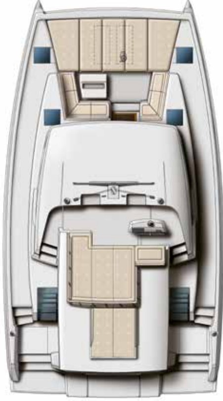
DECK AND FLYBRIDGE Pont & flybridge