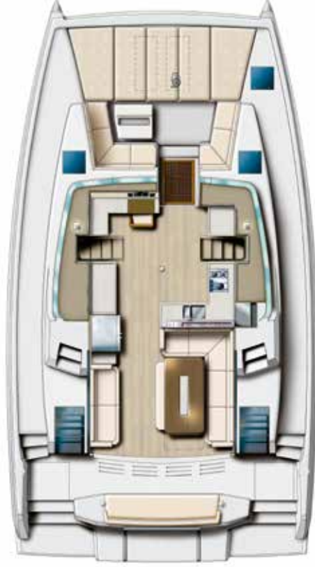
COCKPITE AND SALON Cockpit & Salon