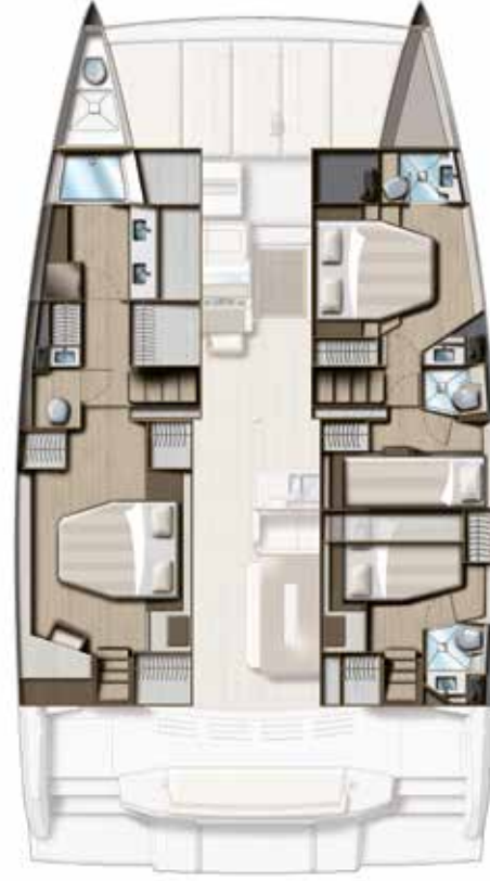
4 CABIN VERSION (owner) / 4 BATHS Version 4 cabines / 4 sdb (coque propriétaire)