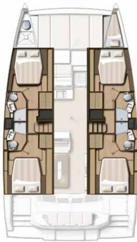
4 CABIN VERSION / 4 BATHS Version 4 cabines / 4 sdb