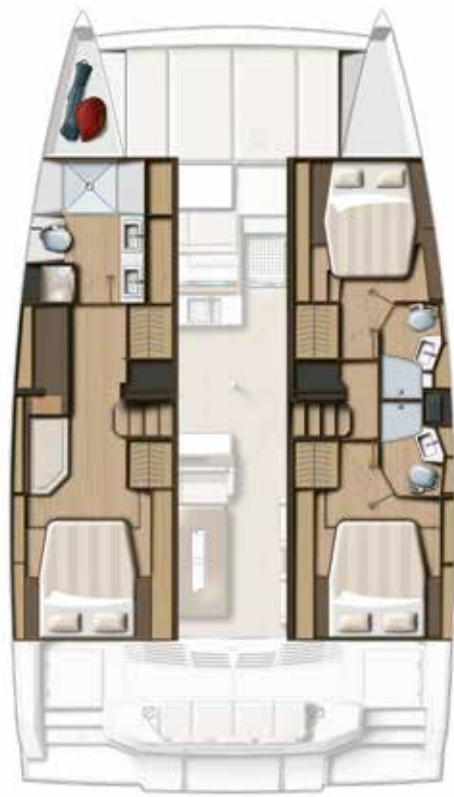
3 CABIN VERSION / 3 BATHS Version 3 cabines / 3 sdb